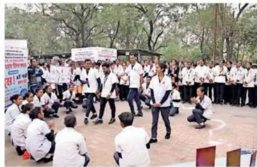
नुस्कड़ नाटक के संघन से छात्रों ने लोगों को किया जागरूक।