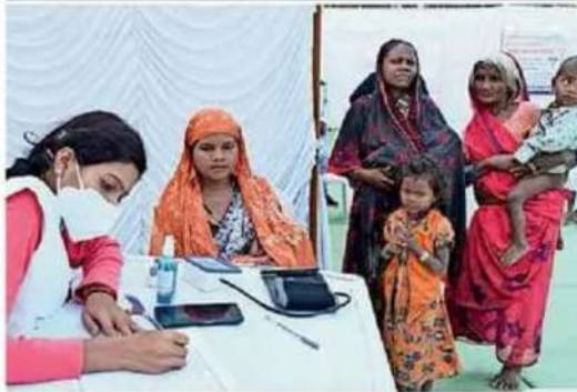
मेगा हेल्थ कैंप के दौरान स्वास्थ्य परीक्षण करते चिकित्सक।

से आरोग्य परियोजना के अंतर्गत नागरिक लाभान्वित हुए। शिविर में गहनिया गांव में मेगा हेल्थ कैंप के विशेषज्ञ सेवाएं जैसे दंत, त्वचा, हड्डी, स्त्री रोग, ईएनटी, मेडिसिन, सामान्य