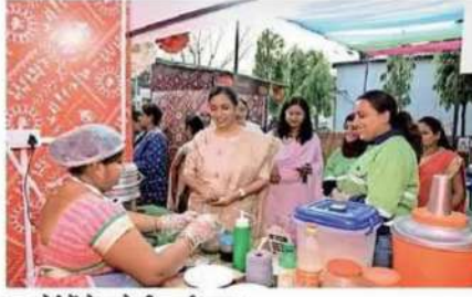
फूड कोर्ट में गोलगप्पे की लगाई स्टाल।

होती है। उन्नति चौपाल महिलाओं की व्यंजन कौशल और उद्यमशीलता को भी सामने रखा है। उन्नति परियोजना से स्थापित खाद्य सूक्ष्म उद्यम इकाई छत्तीसा के लिए बेहतर कदम है, जिसने इन महिलाओं को सूक्ष्म उद्यम को सफलतापूर्वक चलाने जरूरी कौशल, अनुभव, वित्तीय, व्यवसाय और प्रबंधन कौशल प्रदान किया है। उन्नति चौपाल को शुरू करने से पहले महिलाओं को विभिन्न प्रकार के सैंडविच, वड़ा, मंगोड़ी, खाजा, सलोनी समेत पारंपरिक और फास्ट-फूड व्यंजनों को तैयार करने प्रशिक्षण दिया। प्रशिक्षित महिलाएं चौपाल के साथ ही बालको संयंत्र के भीतर लांच उन्नति कैफे ऑन व्हील्स फूड ट्रक