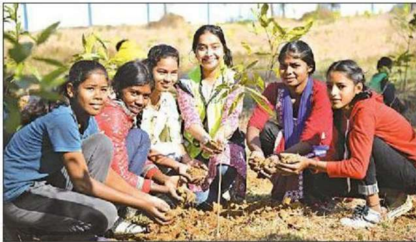
Plantation drive under way.