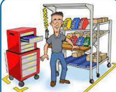
After implementing 5S