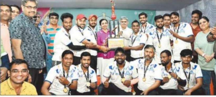
बालको के ट्रांसजेंडर विजयी प्रतिभागी।