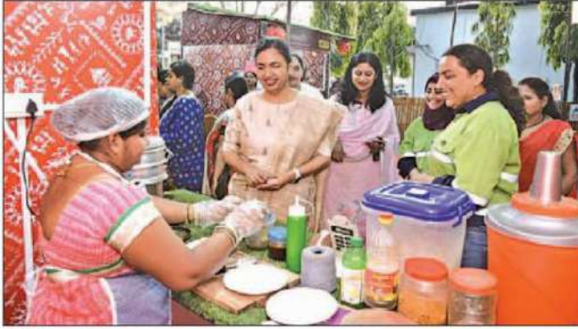
Balco's food court.