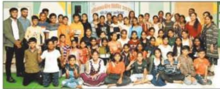
शिविर में उपस्थित छात्र-छात्राएं।

कक्षा 10वीं के लिए विज्ञान, अंग्रेजी और गणित तथा 12वीं के लिए भौतिकी, रसायन विज्ञान, जीव विज्ञान, अंग्रेजी और लेखाशास्त्र विषय में 6 सदस्यों की टीम द्वारा