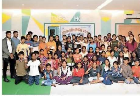
शीतकालीन शिविर में मौजूद छात्र-छात्राएं।

बालको कंपनी के प्रोजेक्ट कनेक्ट से शीतकालीन शिविर में रोजाना एक घंटे की सत्र लगाई गई और कक्षा 6वीं से 12वीं के छात्रों को परीक्षा की तैयारी कराई। कैरियर संबंधी जानकारी भी छात्रों को दी। विद्याभवन सोसायटी की साझेदारी और जिला शिक्षा विभाग के सहयोग से यह साप्ताहिक शिविर सफलतापूर्वक आयोजित किया गया। शिविर के दौरान कक्षा 10वीं के लिए विज्ञान, अंग्रेजी और गणित और 12 वीं के लिए भौतिकी, रसायन विज्ञान, जीव विज्ञान, अंग्रेजी और लेखाशास्त्र विषय में 6 सदस्यों की टीम ने रोजाना एक घंटे का सत्र आयोजित किया। इसमें प्रश्न-पत्र पैटर्न से परिचय, वर्कशीट और मॉडल पेपर का उपयोग कर विभिन्न विषयों का अभ्यास, संदेह निवारण, समय प्रबंधन, प्रेरणा और जरूरतमंद छात्रों पर व्यक्तिगत ध्यान देना शामिल रहा। विषय-विशेषज्ञों ने छात्रों को कैरियर परामर्श और विभिन्न प्रतियोगी परीक्षाओं के बारे में विस्तार से जानकारी दी। भविष्य में विषय अनुसार स्ट्रीम और कैरियर चुनने के विकल्प की जानकारी साझा की। शीतकालीन शिविर से छात्रों ने समय का सदुपयोग करते हुए इन्हें जीवन में आगे बढ़ने की सीख दी। रचनात्मकता को बढ़ावा देने छात्रों में पहेलियां, कहानी सुनाना और मॉडल बनाने जैसी आकर्षक कार्यक्रम शामिल की गईं। विभिन्न शैक्षणिक सत्र के साथ छात्रों ने इनडोर और आउटडोर खेल, विज्ञान और समूह प्रतियोगिता में भाग लिया। 21वीं सदी के कौशल पर ध्यान केंद्रित करते हुए सभ्यता, रचनात्मकता और संचार को बढ़ावा देने वीडियो और डिजिटल उपकरणों का उपयोग की जानकारी भी दी।