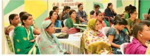
प्रशिक्षण कार्यक्रम में उपस्थित महिलाएं।

बालको कंपनी ने अपने मितान भवन में महिला आरोग्य समिति व ग्राम स्वास्थ्य स्वच्छता व पोषण समिति के सदस्यों के लिए दो दिनी प्रशिक्षण कार्यक्रम आयोजित की, जिसमें 100 से अधिक सदस्यों ने हिस्सा लिया। 45 फ्रंटलाइन वर्कर भी तैयार किया है, जो बालको कंपनी के सामुदायिक सदस्यों के बीच पहुंचेंगे। टीबी बीमारी व स्वास्थ्य के प्रति जागरूक करेंगे। टीबी जागरूकता, पहचान, कारण, संपर्क ट्रेसिंग और परीक्षण में सुधार को लेकर प्रशिक्षण कार्यक्रम के बाद फ्रंटलाइन वर्कर्स की टीम का गठन किया गया है। ताकि बेहतर क्षमता से विकसित कार्य योजना के बलबूते टीबी रोग की चुनौतियों का सामना किया जा सके।