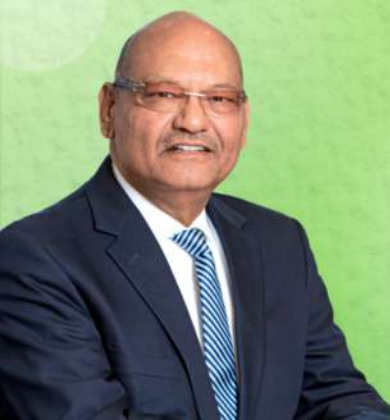
Anil Agarwal Chairman, Vedanta Limited