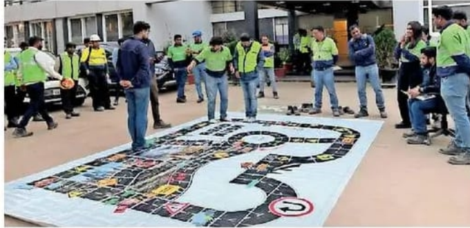
सड़क सुरक्षा को लेकर जागरूक करने आयोजित कार्यक्रम में शामिल बालको कर्मचारी।