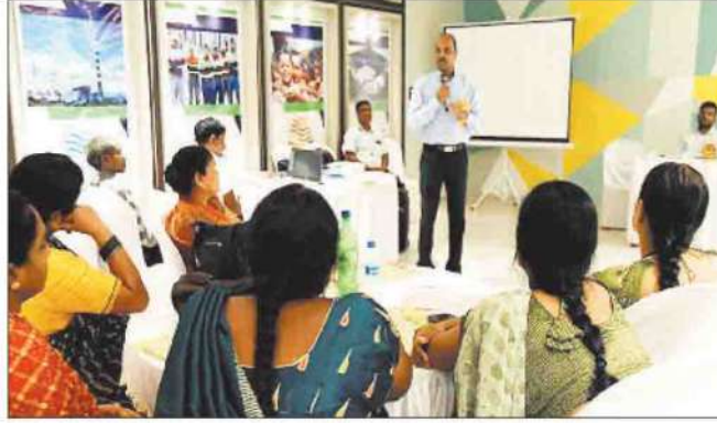
टीबी रोग के बारे में जानकारी देते चिकित्सक।