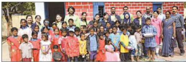
A glimpse of Wish Tree initiatives .