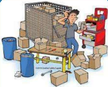
Before implementing 5S