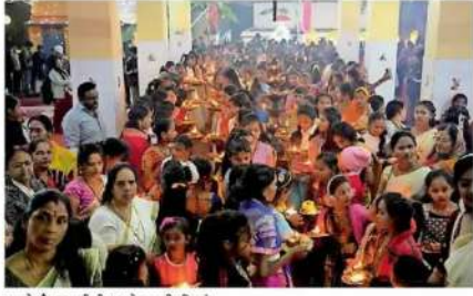
पूजा के दौरान आरती की माल लेकर खड़ी महिलाएं।