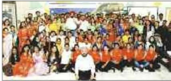
कार्यक्रम में शामिल प्रशिक्षणार्थी।

कार्यक्रम में व्यक्तिगत विकास और व्यावसायिक विकास दोनों को बढ़ावा देने के लिए डिजाइन की गई प्रतियोगिताएँ शामिल थीं। इनका उद्देश्य छात्रों के अपने-अपने ट्रेड