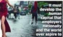
It must develop the human capital that employers nationally and the world over aspire to

review of agriculture to enhance productivity through larger farm sizes, more diversified and higher-value crops, and commercial farming.