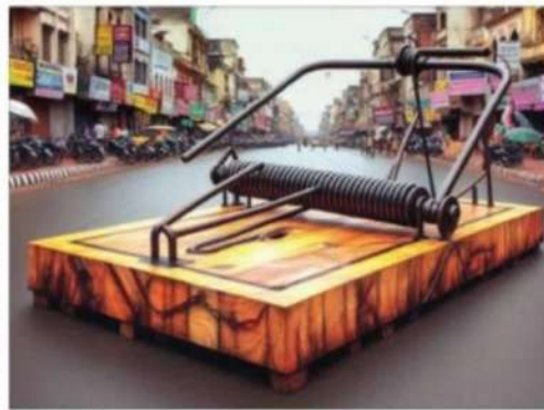
Spring to action

► Low enrolment in higher ed Despite GER in elementary and middle school stages improving to near-national levels, and the literacy rate going up to 61% (compared to 73% nationally), its enrolment ratio in secondary school and above remains low. Dropout rate remains high, and college den-