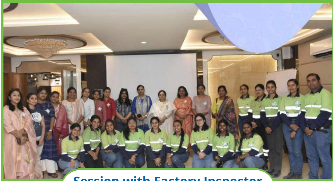
Session with Factory Inspector Korba at Ladies Club