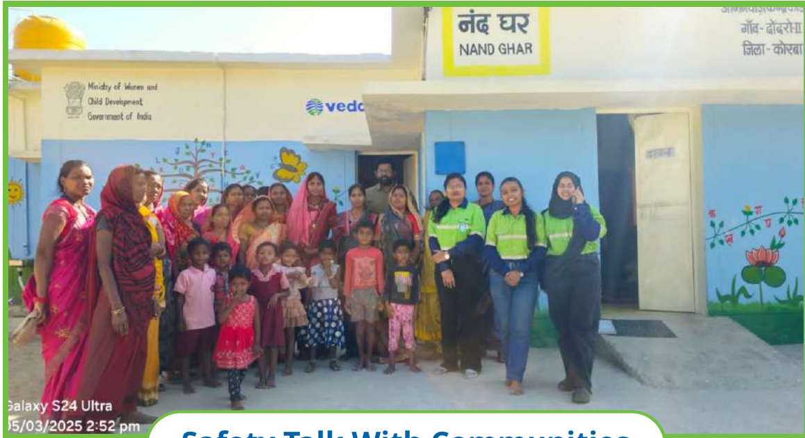
Safety Talk With Communities