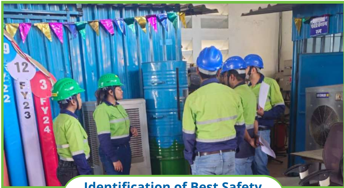
Identification of Best Safety Zone at Shopfloor