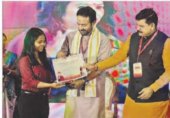
One of the women professionals receiving honour.