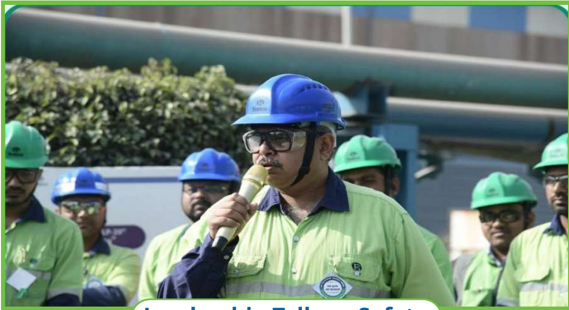
Leadership Talk on Safety

Reaffirming its commitment to safety, BALCO organised a series of initiatives in and around the plant to mark the 54th National Safety Week. The week-long celebrations featured a safety rally, leadership talks, safety oaths, and expert sessions with renowned speakers. Engaging employees, business partners, communities, and children, the activities also included drawing and slogan competitions at the plant and schools, health camps, and the Kaun Banega Safety Champion quiz competition. The Run for Safety marathon further reinforced the message of safety awareness, uniting all stakeholders in fostering a culture of vigilance and responsibility.