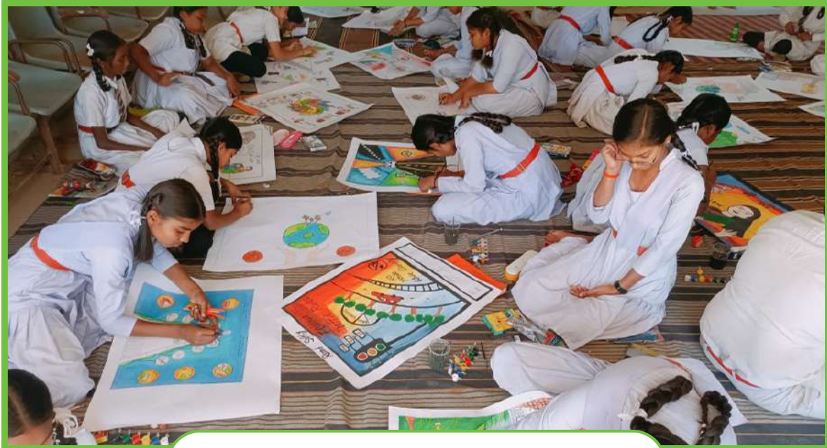
Drawing Competition at Schools