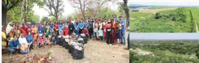
पर्यावरण संरक्षकता | रायपुर www.dalypioneer.com

कंपनी ने 150 हेक्टेयर से अधिक फैले अनुपयोगी फ्लाई ऐश डाइक क्षेत्र का वनीकरण किया