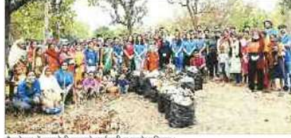
पौधरोपण में सहयोगी बालको कर्मचारी व उनके परिजन।