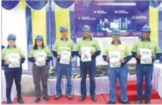
Balco authorities presenting posters.