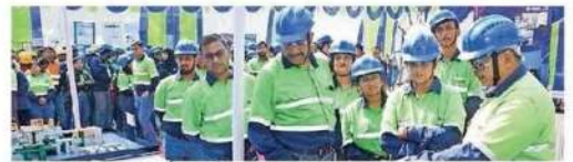
साप्ताहिक उत्सव के दौरान मौजूद बालको के अधिकारी-कर्मचारी।

प्रतिभागियों की गुणवत्ता प्रणालियों और प्रक्रियाओं पर उनकी समझ को परखा। 'चाय पर चर्चा' सत्र ने कर्मचारियों को खुलकर अपने अनुभव और गुणवत्ता संस्कृति को सुझाव देने का अवसर दिया। डिफेक्ट्स हंट अभियान ने टीमों को गुणवत्ता की कमियों की पहचान और मूल कारण विश्लेषण (आरसीए) करने जैसे प्रभावी सुधारात्मक कदम सुझाने के लिए प्रेरित किया। इससे सुधार प्रक्रियाओं में सक्रिय भागीदारी और जिम्मेदारी की भावना विकसित हुई। वरिष्ठ प्रबंधन ने गेम्बा वॉक के माध्यम से फ्रंटलाइन टीमों से संवाद कर उनके प्रयासों की सराहना की और उनके नवीन विचारों को समझा।