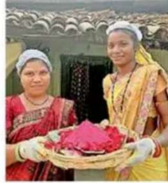
महिलाओं द्वारा तैयार हर्बल गुलाल।

बालको की उन्नति परियोजना से डेकोराती माइक्रो-एंटरप्राइज के तहत 3 एसएचजी समूहों की महिलाएं ने हर साल होली पर्व पर गुलाल बनाने का कार्य करती है। 12 समूह की महिलाएं इस काम में लगी है। लोगों को हर्बल गुलाल उपलब्ध कराकर होली पर स्वास्थ्य और पर्यावरणीय जिम्मेदारियों के प्रति भी सचेत रहने की सीख दी है। पौधों की जड़ों और उसके पत्ते से निकाले गए प्राकृतिक रंग हमारी त्वचा के लिए सुरक्षित है। साथ ही पर्यावरण