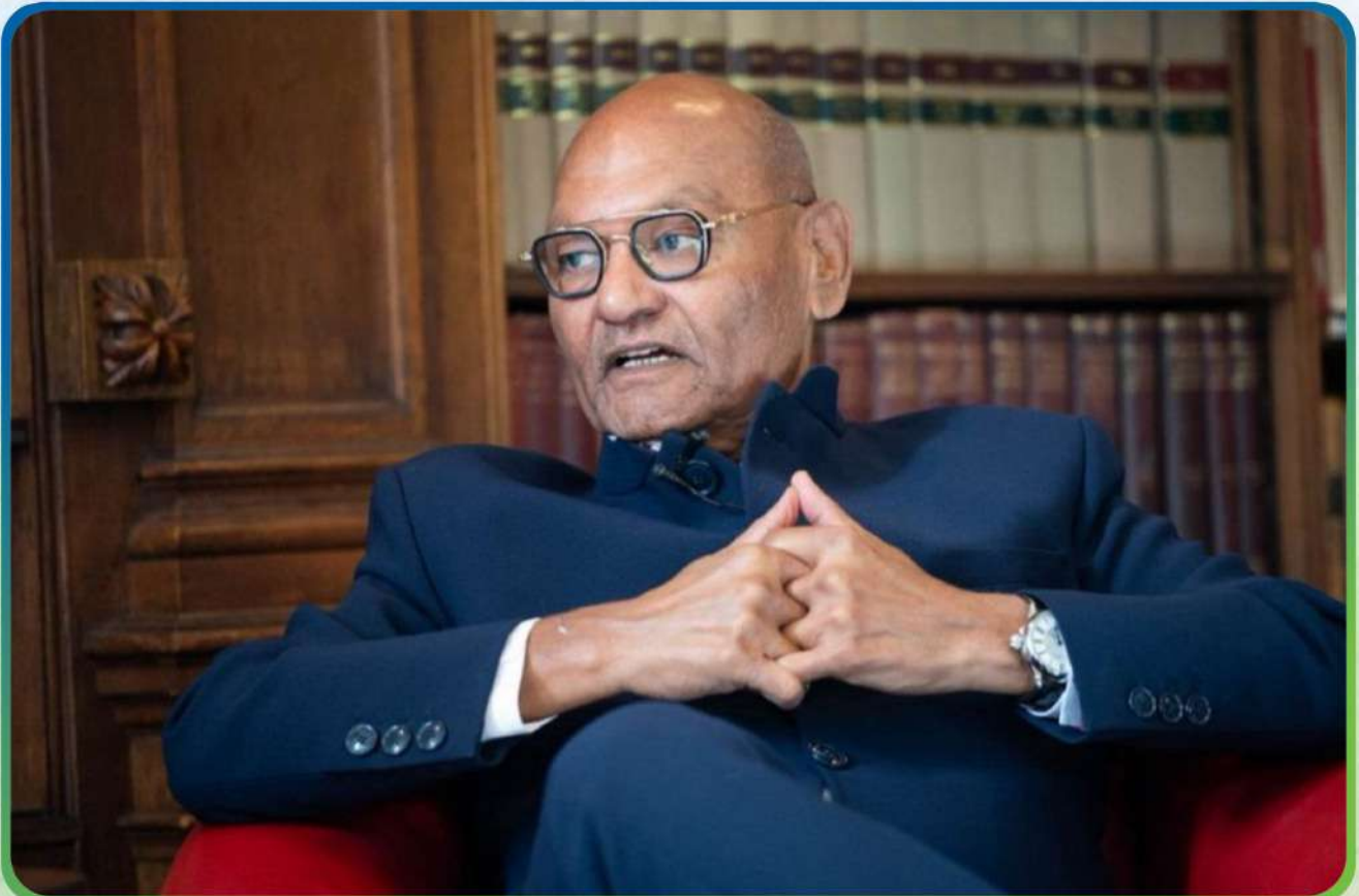
Anil Agarwal Chairman, Vedanta Limited

आज के समय, सबसे जरूरी ये है कि आप पॉजिटिव बने रहें और अपनी आजीविका कमाएँ। इसीसे आपमें गजब का कॉन्फिडेंस आएगा, और अगर मन में है विश्वास... तो फिर मंजिल दूर नहीं।