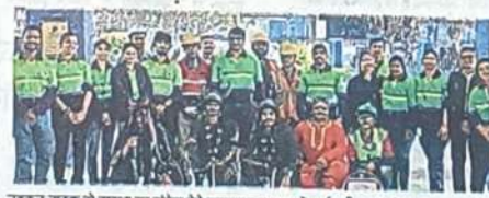
नुक्कड़ नाटक से सुरक्षा का संदेश देते कलाकार व साथ में कर्मचारी •