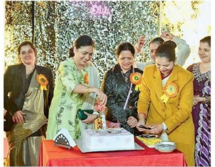
क्लब के 52 वर्ष पूरे होने पर केक काटते सदस्य।