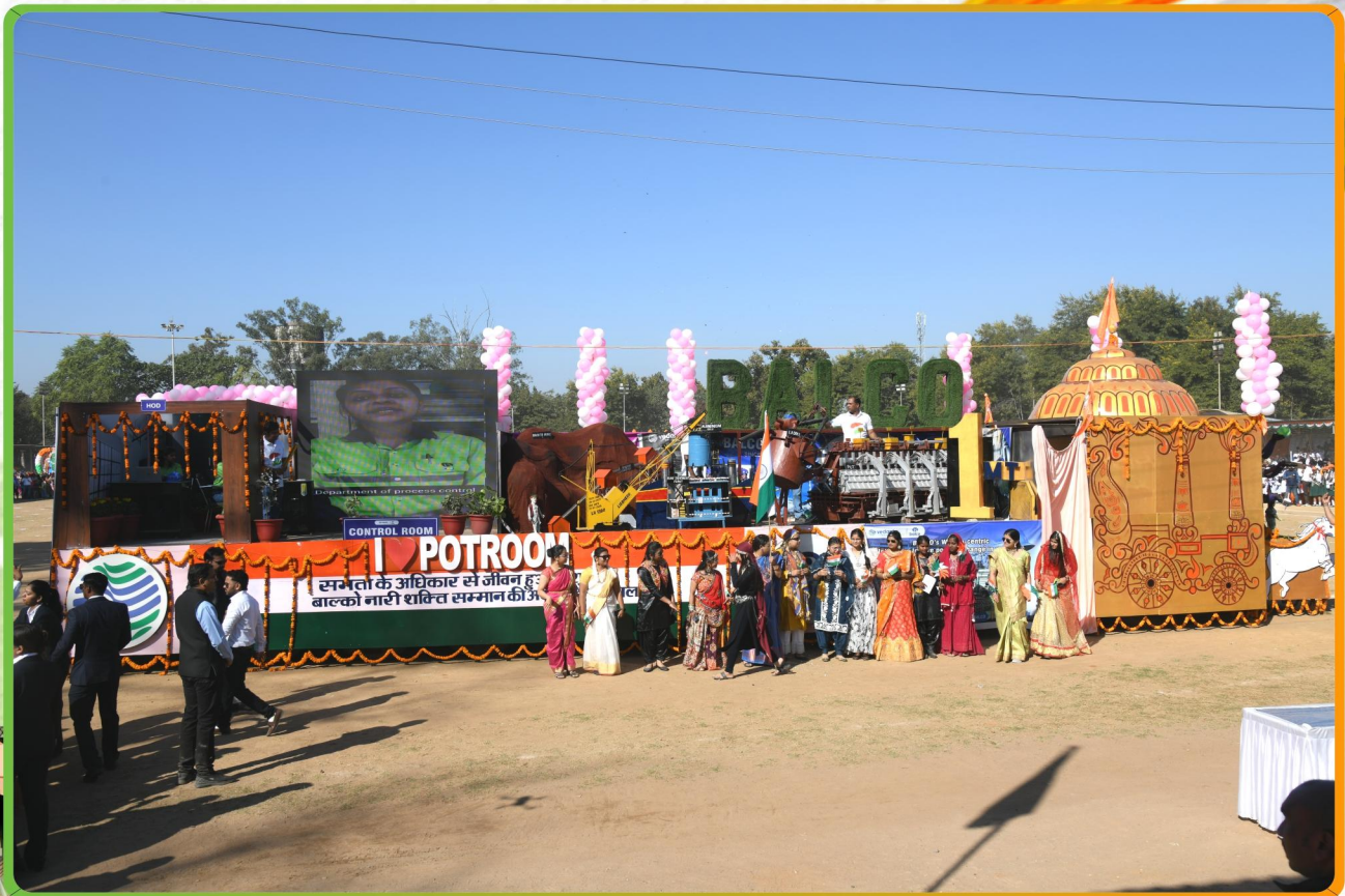
Potroom Tableau won the 1 st Prize