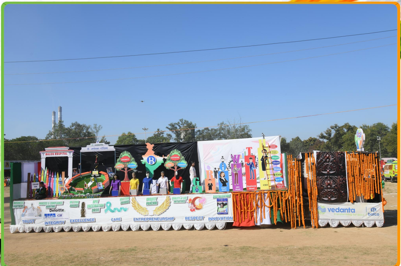
HR Tableau won the 2 nd Prize