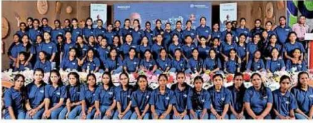
प्रोजेक्ट पंछी के तहत चर्चित छात्र-छात्राएं।