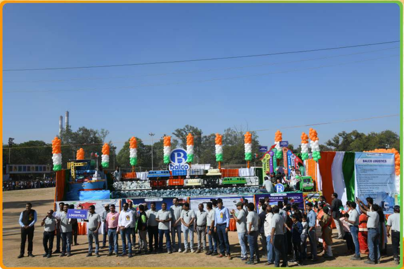
Logistics Tableau won the 3 rd Prize