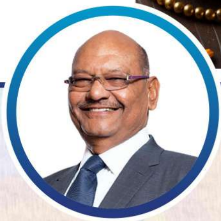
MR. ANIL AGARWAL Chairman, Vedanta Group