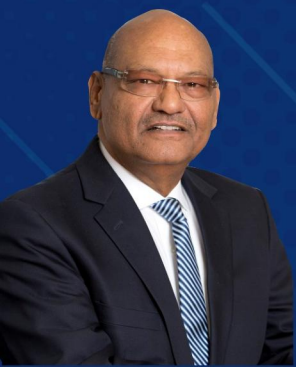
MR. ANIL AGARWAL Chairman, Vedanta Group