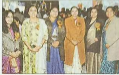
Office-bearers of Balco Ladies Club.

More than 500 members of the BALCO family enthusiastically took part in the celebration, enjoying a wide range of cultural performances and family-