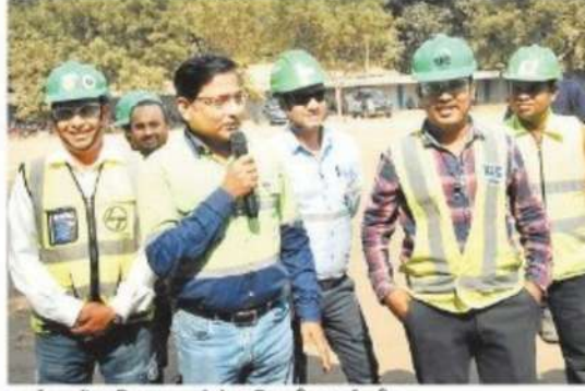
कार्यक्रम में उपस्थित बालको के अधिकारी व कर्मचारी।

आयोजित किये हैं। कंपनी जिला प्रशासन के सहयोग से समुदाय में सड़क सुरक्षा नियमों का पालन करने के प्रति आवश्यक दिशानिर्देश और जागरूकता प्रदान करने के लिए प्रतिबद्ध है। कंपनी का उद्देश्य है कि समुदाय में सभी जिम्मेदार एवं सजग नागरिक होने के नाते नियमित सड़क सुरक्षा उपायों को अपने दैनिक जीवन का हिस्सा बनायें।