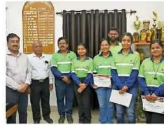
कार्यक्रम में निक्षय मित्रों का किया सम्मान।

टीबी के नियंत्रण व रोकथाम पर चर्चा कर जागरूकता बढ़ाने प्रयास करें: डॉ. केसरी