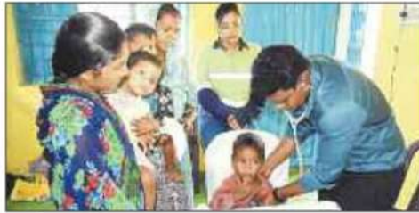
बच्चे की जांच करते चिकित्सक।