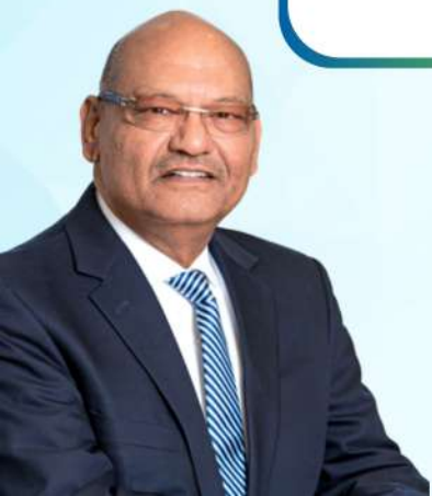
Anil Agarwal Chairman, Vedanta Limited