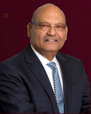
MR. ANIL AGARWAL Chairman, Vedanta Group